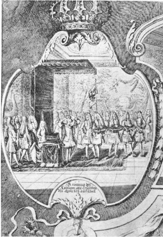
König Friedrich I. krönt sich selbst in Königsberg. (Zeitgenössischer Stich)

In politischer Hinsicht hat der König, dem ein größerer Erfolg versagt wurde, seinen Nachkommen eine große Aufgabe gestellt: den „König in“ zu einem „König von“ Preußen umzuwandeln, was seinem Enkel, Friedrich dem Großen, auch gelang.