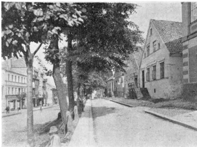
Einst am Philosophendamm in Lyck

Wenn hier im Einzelnen erzählt wird, wie es heute in der Hauptstadt Masurens, in Lyck, aussieht, so nicht nur, um den Einwohnern dieser Stadt ein Bild zu geben, sondern auch weil das Schicksal Lycks bezeichnend ist für das vieler anderer ostpreußischer Städte. Auch von diesen würde es in den Berichten ähnlich heißen: Zerstört, zerstört, zerstört . . . Lyck hatte früher saubere, gepflegte Straßen, ordentlich gebaute Häuser, wohlbestellte Äcker und Felder; Fluss und See waren wohl eingedämmt. Über dem Ganzen lag der Hauch deutscher Ordnung, deutscher unermüdlicher Arbeit? Und jetzt?